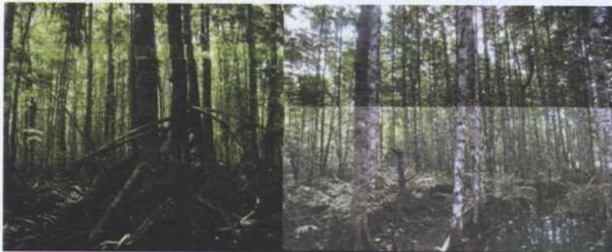
Gambar (Figure) 2. Keadaan tegakan R. mucronata dan B. cylindrica di Bedul, TNAP ( Standing stock R. mucronata and B. cylindrica in Bedul, APNP )

Regenerasi merupakan fenomena alam dimana pohon yang muda akan menggantikan pohon dewasa karena sesuatu sebab, misalnya ditebang, terbakar, tumbang (bencana alam) atau mati secara fisiologis. Adapun regenerasi jenis tumbuhan di hutan mangrove disajikan pada Tabel 2. Pada Tabel 2, jenis yang mendominasi di lokasi penelitian untuk tingkat pohon yaitu B. cylindrica dengan INP 124,1% dan tingkat semai yaitu jenis R. mucronata dengan INP sebesar 110,0%, sedangkan untuk tingkat belta pada semua plot tidak terdapat, hal ini menunjukkan kalau regenerasi di hutan mangrove TNAP tidak sempurna dan cenderung mengelompok per jenis.